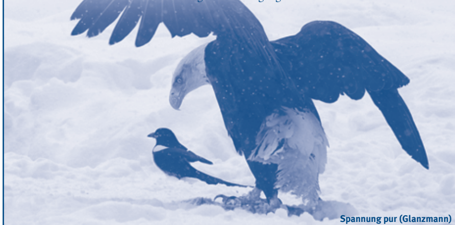
Spannung pur (Glanzmann)

Gerne arbeiten wir für Sie ein passendes Flugangebot aus.