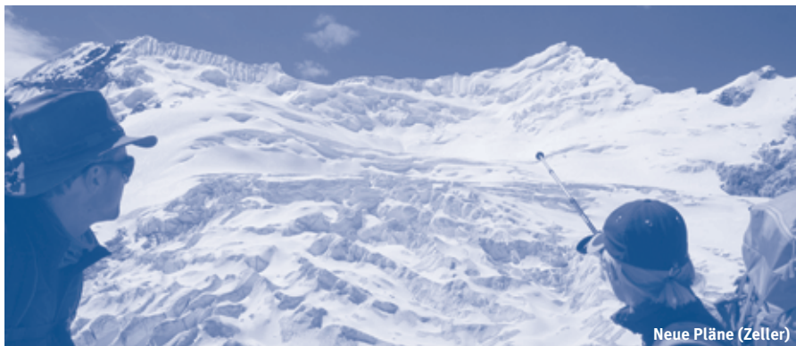
Neue Pläne (Zeller)