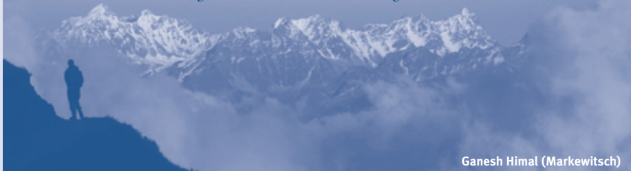
Ganesh Himal (Markewitsch)

Was für ein Genuss nach einem langen Marschtag hier zu baden!