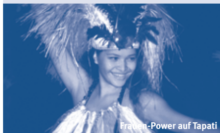
Frauen-Power auf Tapati

Mehr Abwechslung geht nicht! 3CLK3301 07.02.13–24.02.13 € 5.995,-