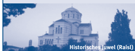
Historisches Juwel (Raisl)