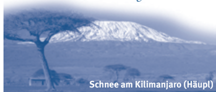
Schnee am Kilimanjaro (Häupl)

Haben Sie schon den Kilimanjaro-Baukasten in unserem Katalog gesehen? Unter vier verschiedenen Aufstiegsrouten können Sie Ihre Wunschroute wählen. Bei zwei Touren ist ein Vorprogramm in den Chyulu-Bergen möglich; Sie nähern sich dem Kilimanjaro zu Fuß und finden Ihren persönlichen Gehrhythmus, bevor Sie zum „weißen Dach Afrikas“ aufbrechen. An alle Bergbesteigungen kann eine Safari angehängt werden. Drei stehen zur Auswahl. Sie führen z. B. in den Ngorongoro-Krater, die Serengeti, Maasai Mara oder in den Amboseli. Strand und Palmen bietet die Badeverlängerung auf Sansibar. Und das Beste: Die Durchführung aller Bau- steine ist ab zwei Personen garantiert!