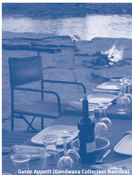
Guten Appetit