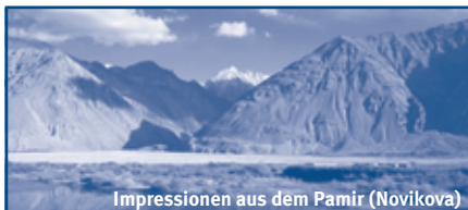
Impressionen aus dem Pamir (Novikova)

Hauser exkursionen international GmbH • Spiegelstr. 9 • 81241 München • Tel: 089/235006-0 • Fax: 089/235006-99 • info@hauser-exkursionen.de