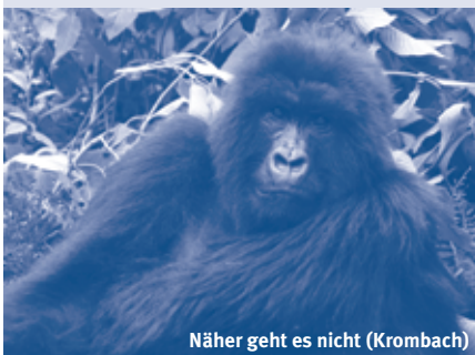
Näher geht es nicht (Krombach)

Die Menschen in Ruanda sind freundlich und Touristen gegenüber sehr aufgeschlossen. Und die Natur ist atemberaubend! Auf den Feldern wächst Tee, Kaffee, Mais und sogar Reis. Das Straßennetz ist sehr gut ausgebaut, lediglich die Piste entlang des Kivu-Sees ist abenteuerlich. Im Nyungwe-Nationalpark gibt es Wanderwegen für jeden Geschmack, egal ob man nur zwei Stunden wandern oder drei Tage durch den Regenwald trekken will. Das Schimpansen-Tracking ist spannend. Nach einem längeren Marsch durch den Regenwald habe ich sie endlich schemenhaft zu Gesicht bekommen. Doch bevor ich die Kamera zücken konnte, prasselte tropischer Regen los, die Affen waren weg.