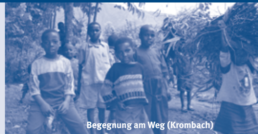
Begegnung am Weg (Krombach)

Bei der Fahrt entlang des Lake Kivu geht es steil bergauf und bergab. Immer wieder öffnet sich der Blick auf den See. Im Volcanoes-Nationalpark erfüllte sich beim Besuch der Gorillas ein Lebenstraum von mir. Schon in der Nacht zuvor habe ich kein Auge zugemacht. Die Touristen werden in Gruppen eingeteilt. Maximal acht Personen gehen zu verschiedenen Gorillafamilien. Ich bekam Gänsehaut. So nah, so friedlich! Die Jungtiere spielten, die Großen knabberten an Blättern und lagen in der Sonne. Der Silberücken hatte alle im Blick – seine Familie und uns. Noch nie ist eine Stunde so schnell vergangen! Und als ob die Tiere spürten, dass die Zeit um war, zogen sie sich langsam immer weiter in den dichten Wald zurück.