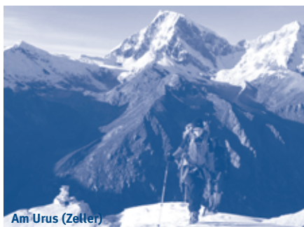
Am Urus (Zeller)