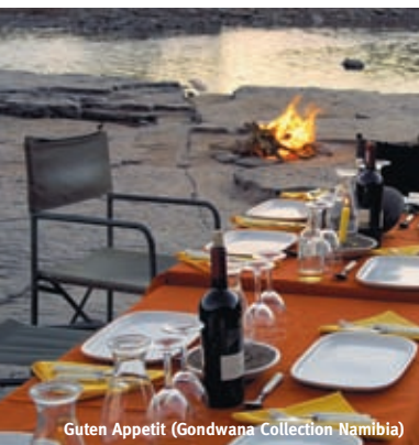
Guten Appetit

Bei dieser Tour hinterlassen Sie nur Ihre Fußspuren! Abfall wird getrennt und zum nächsten Ort transportiert. Im Gondwana Canyon Park, dem mit 1.260 km 2 größten privaten Naturschutzgebiet im Südlichen Afrika, tragen Maultiere ihr Gepäck. Das Essen wird am Lagerfeuer zubereitet, Sie schlafen im Zelt oder genießen draußen im Schlafsack eingekuschelt den Sternenhimmel. Die raue Schönheit des Fish River Canyons und seine Ausmaße sind gigantisch: 160 km ist er lang, bis zu 27 km breit und 500 m tief. Damit gilt er als der größte Canyon Afrikas und nach dem Grand Canyon in den USA als zweitgrößter der Welt. Seit dem Bruch des Urkontinents Gondwana vor 120 Mio. Jahren fraß der Fluss sein Schluchtensystem in das Gestein. In Gesprächen am abendlichen Lagerfeuer erfahren Sie von Ihren Tourführern viel Wissenswertes über das Land und seine Bevölkerung.