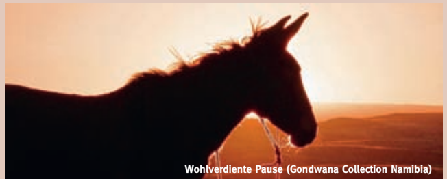
Wohverdiente Pause

In der Wüste ist ein wachsamer Umgang mit der Natur besonders wichtig. Die Nama Karoo samt Fish River Canyon erkunden Sie während eines komfortablen Trekkings: Maultiere tragen das Gepäck, so dass Sie unbeschwert die Natur und das leckere Essen genießen können. Weite Ebenen mit markanten Köcherbäumen widersprechen dem landläufigen Wüstenbild. Die Sukkulenten Karoo ist eine Wunderwelt aus bizarren Pflanzen und Gewächsen; hier wandern Sie in den Aus-Bergen. Und schließlich die Namib: Liebevoll kümmert man sich um Sie auf dem dreitägigen Tok Tokkie Trail im NamibRand-Gebiet. Das Bett ist schon gemacht, der Tisch gedeckt und der klassische Sundowner kaltgestellt. Sogar der Kaffee wird früh ans Bett gebracht, nur wandern müssen Sie selbst. Freuen Sie sich auf weite, unberührte Landschaft, charmante Unterkünfte und „tierische“ Urlaubsbekanntschäften: Oryx, Impalas und viele mehr dürfen Sie auf den Pirschfahrten erwarten. Zudem erfahren Sie viel über Projekte unserer Partner, die Wüste, Land und Tiere schützen.