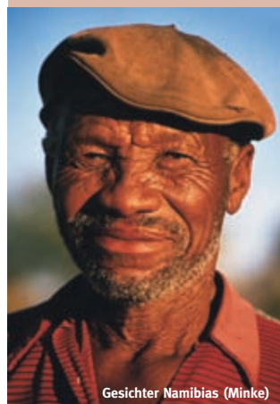
Gesichter Namibias (Minke)

Rufen Sie an 089 / 23 50 06-27 oder fordern Sie das Detailprogramm an (Tournr. NASo2).