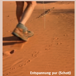
Entspannung pur (Schott)