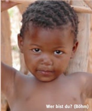
Wer bist du? (Böhm)