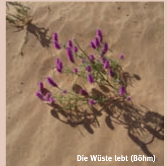
Die Wüste lebt (Böhm)

Beide Trails sind individuell buchbar. Preise und Termine auf Anfrage.