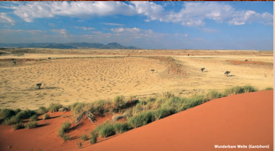
Wunderbare Weite (Gantzhorn)