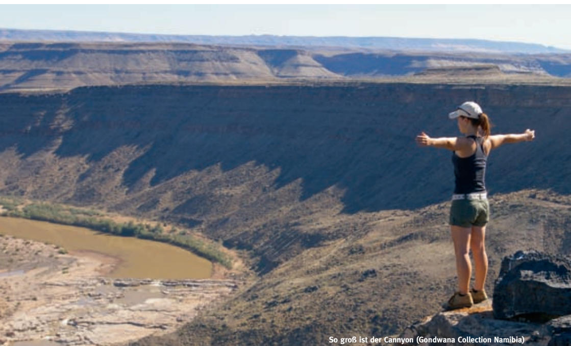
So groß ist der Canyon (Gondwana Collection Namibia)