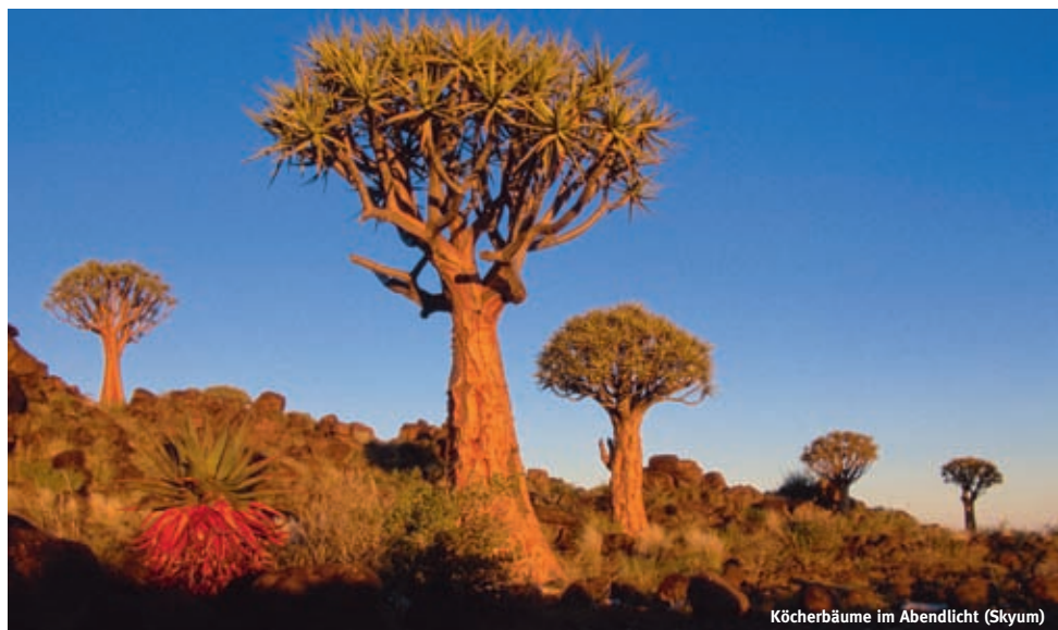
Köcherbäume im Abendlicht (Skyum)