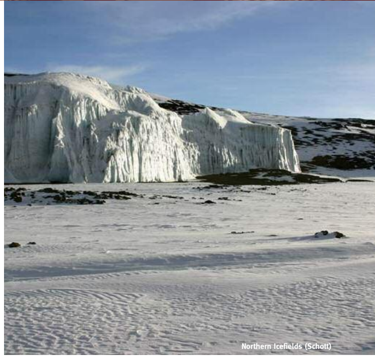
Northern Icefields (Schott)

Die Machame-Route wird oft als „die schönste Route am Kilimanjaro“ bezeichnet. Aufgrund der Feuchtigkeit auf dieser Bergseite ist die Vegetation tropisch. Quer durch den üppigen Regenwald mit Baumflechten, manns-hohen Senecien und kleinen Wasserläufen kommen Sie Ihrem Ziel jeden Tag ein Stück näher. Stellen Sie sich auf steiles und rutschiges Gelände ein, manchmal müssen Sie auch die Hände zu Hilfe nehmen. Auf dieser Route sind Sie immer wieder aufwärts und abwärts unterwegs – einerseits sehr anstrengend, andererseits gut für die Höhenanpassung. Beim Abstieg auf der Mweka-Route können Sie erneut das Regenwalderlebnis genießen und in Ruhe an Ihren persönlichen Gipfelmoment zurückdenken.