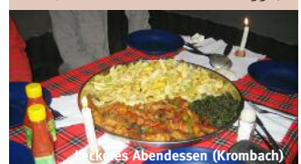
Mkarakoo Abendessen (Krombach)

Termine Basisreise: Preis: Abflug wöchentlich immer Samstag Anfang Dez. – Ende März € 2.350,- Mitte Juni – Ende Oktober € 2.350,-