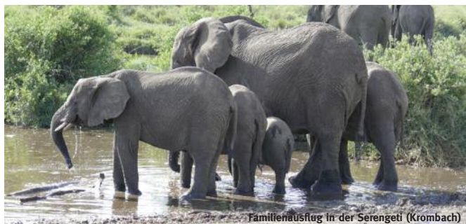
Familienausflug in der Serengeti (Krombach)