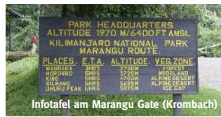
Infotafel am Marangu Gate (Krombach)

Profil: Gute Kondition, Ausdauer. Wandern auf guten Wegen; anstrengende Aschfelder am langen Gipfeltag. Hüttenübernachtungen.