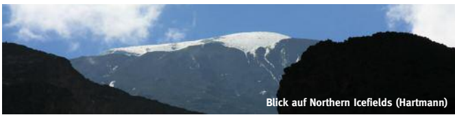
Blick auf Northern Icefields (Hartmann)