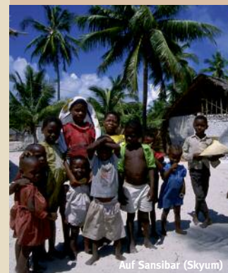
Auf Sansibar (Skyum)

Alle Hotels mit eigener Tauchbasis, Wellness und Massage. Ausflüge nach Stone Town und Gewürztour sind vor Ort buchbar.