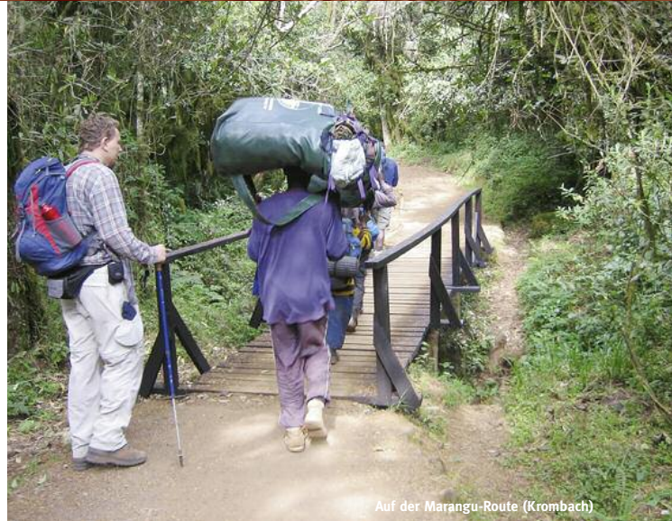
Auf der Marangu-Route (Krombach)

Auf der Hüttenroute ist der Besucherstrom mittlerweile limitiert, es erwarten Sie also keine Menschenmassen. Der Aufstieg führt Sie durch üppig grünen Regenwald mit Flechten an den Ästen der Bäume und zahlreichen kleinen Bachläufen. Auf 3.700 m Höhe übernachten Sie zweimal und machen einen Tagesausflug in Richtung Mawenzi auf ca. 4.300 m Höhe. Ihre Schlafhöhe ist also niedriger, als die erreichte Tageshöhe. Dies dient der Akklimatisation, erleichtert Ihnen den Aufstieg und erhöht Ihre Chancen, schließlich auf dem „weißen Dach Afrikas“ zu stehen.