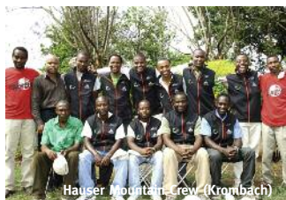
Hauser Mountain Crew (Krombach)