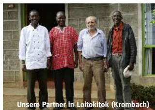
Unsere Partner in Loitokitok (Krombach)