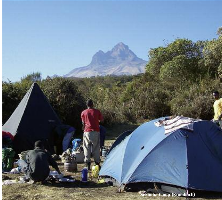
Sekimba Camp (Krombach)

Auf dem direkten Weg über die Nalemoru-Route steigen Sie in gleichmäßigen Etappen auf. Während der fünf Tage haben Sie die wenigsten Kilometer zu gehen; Sie erreichen meist am Nachmittag das Camp, die Zelte werden von der Mannschaft aufgebaut. Wir empfehlen, noch ein paar zusätzliche Höhenmeter aufzusteigen. Damit ist die erreichte Tageshöhe höher als die Schlafhöhe, dies dient der guten Akklimatisation. Der direkte Weg auf den Gipfel bedeutet also nicht, dass Ihnen etwas entgeht, es bedeutet vielmehr entspannten Berggenuss. Die Nordroute ist karg und trocken, aber der Blick auf den Gipfel zieht Sie magisch bergauf. Beim Abstieg auf der Marangu-Route genießen Sie die üppig-grüne Pflanzenwelt im Regenwald.