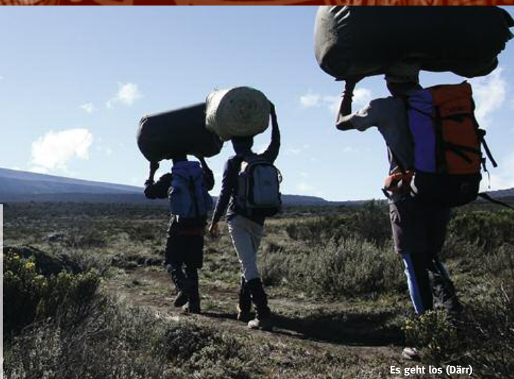
Es geht los (Darr)

Schnüren Sie Ihr ganz persönliches „Kili-Paket“! Wunschroute am Berg (Basisreise), Vorprogramm, Verlängerung und Idealtermin – viel Spaß beim Kombinieren! Jeden Baustein führen wir ab zwei Teilnehmern durch.