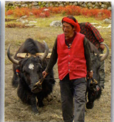
Bei der Feldarbeit

Von hier aus geht es nun über den ersten 5050 m hohen Pass tief in das innere Dolpo hinein. Auf 4750 m schlagen wir die Zelte auf und genießen am Abend eine traumhafte Aussicht auf die Dhaulagiri-Kette und den unvergleichlichen Sternenhimmel im Hochgebirge. Der Pfad führt uns nun einige Tage in unzähligen Windungen entlang des Flusses, in stetigem Auf und Ab, in einer in ihrer Kargheit und Einsamkeit beeindruckenden Landschaft. Wir finden wunderschöne Plätze für unsere Zelte und unser Koch bereitet uns mit seinen begrenzten Mitteln immer wieder erstaunlich schmackhafte Mahlzeiten zu. Wir durchqueren schmucke Dörfer