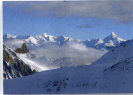
Aussicht vom Kang La gegen Dhaulagiri

berges zum Ziel gesetzt haben. Die Landschaft soll hier grandios sein – leider ahnen wir sie mehr, als dass wir sie sehen. Das Wetter ist schlecht geworden. Schon bei der Überquerung des Passes hat es angefangen zu schneien. Ab hier startet die anspruchsvollste Etappe der ganzen Tour, die Überquerung des 5350 m hohen Kang La, sozusagen die Schlüsselstelle. Acht Stunden sind dafür angesetzt. Normalerweise ist der Pass in dieser Jahreszeit schneefrei. In diesem Jahr jedoch liegt viel Schnee, und während des ganzen Aufstiegs schneit es ununterbrochen. Wir müssen auf 5100 m ein Hochlager einrichten und auf Wetterbesserung hoffen – andernfalls wäre ein Rückzug und Hubschrauberbergung die einzige Alternative. Unsere Gebete müssen wohl von den vielen Göttern oder Bhudda persönlich erhört worden sein – in der Nacht hört es auf zu schneien, es wird ein strahlender Tag und wir mühen uns die restlichen 250 Höhenmeter durch knietiefen Schnee und über eine Wechte auf den Grat. Besonders die Träger mit ihren schweren Lasten haben es schwer.